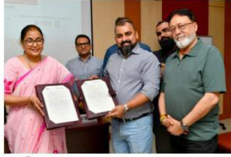
દ્ર. પિ. વ. ન્યુઝ, અમદાવાદ, તા. ૧૧

AACSB-માન્યતા પ્રાપ્ત અગ્રણી બિઝનેસ સ્કૂલ BIMTECHએ Hexalog Technologies Private Limited સાથે વિદ્યાર્થી હિતમાં ત્રણ વર્ષના કરાર કર્યા. આ ભાગીદારી હેઠળ BIMTECH કેમ્પસમાં 'સપ્લાય ચેઇન અને લોજિસ્ટિક્સ' માટે સેન્ટર ઓફ એક્સલન્સ સ્થાપિત કરવામાં આવશે. આ સેન્ટર દ્વારા AI આધારિત લોજિસ્ટિક્સ, સપ્લાય ચેઇન એનાલિટિક્સ અને ડિજિટલ ફેઇટ મેનેજમેન્ટ જેવા ક્ષેત્રોમાં ઉદ્યોગને અનુકૂળ માર્કેટ-કેન્ડેન્શિયલ અને સર્ટિફિકેટ પ્રોગ્રામ્સ શરૂ કરવાની યોજના છે. MoU હસ્તાક્ષર પ્રસંગે BIMTECH ના ડેપ્યુટી ડિરેક્ટર અને ડીન (એકેડેમિક્સ) પ્રોફ. પ