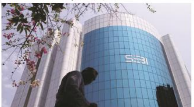
Recent studies conducted by academicians from reputed institutions such as the Birla Institute of Management Technology (BIMTECH), the Vinod Gupta School of Management at IIT-Kharagpur, and the Shallesh J Mehta School of Management at IIT-Bombay have uniformly found that retail prices for none of the suspended commodities decreased after the ban.

Sebi extends futures trading ban on seven agricommodities till Jan 2025